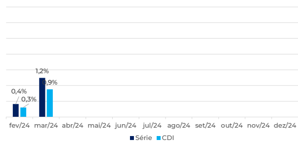
Rentabilidade x CDI