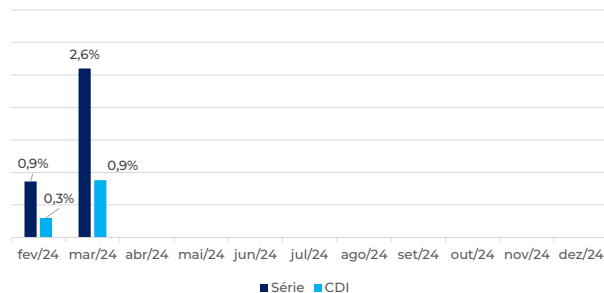
Rentabilidade x CDI